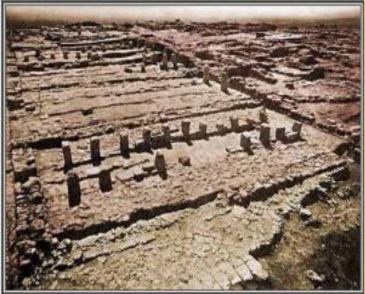
Fig. 10 Solomon's Stables

Solomon's Stables (fig. 10): When the site of Megiddo was excavated in the 1930's archaeologists found structures they identified as stables built to house some of Solomon's chariot force. The buildings were divided by pillars into aisles. The excavators assumed that horses had been quartered in the outer two rows.