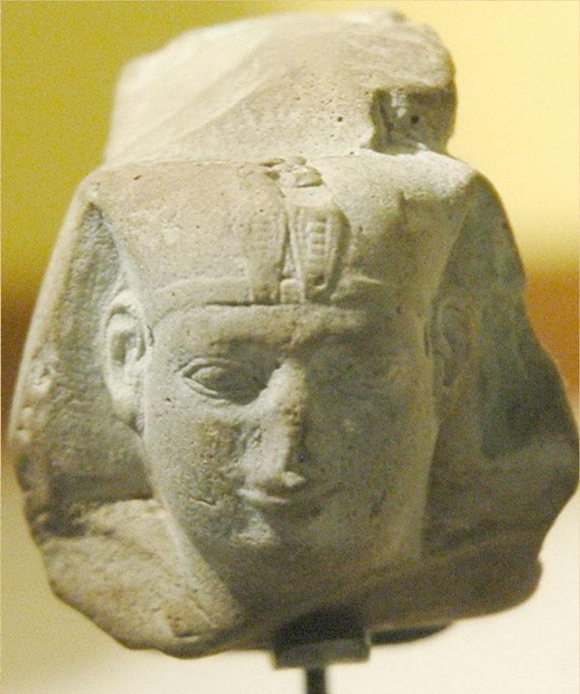
وصورة اللوحة الفرعونية عنه