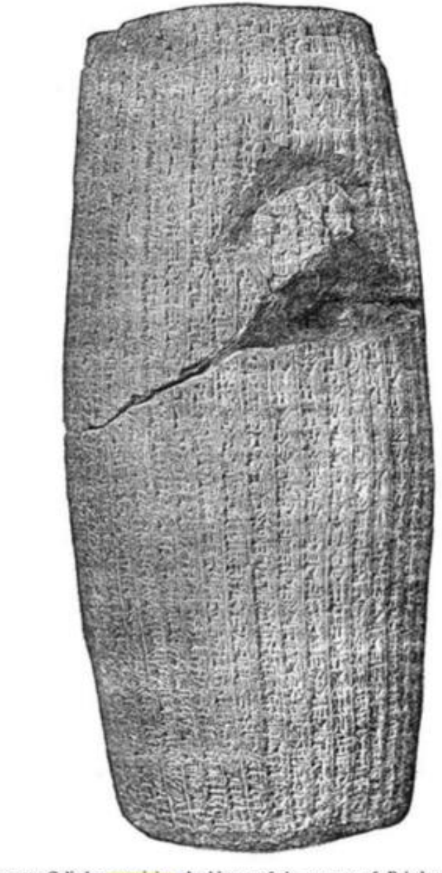
Terra-cotta Cylinder containing the history of the capture of Babylon by Cyrus the Great, king of Persia.