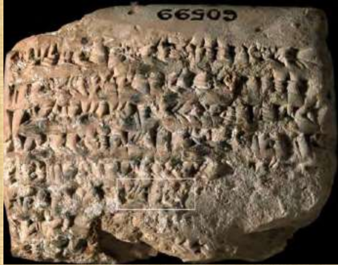
Tablet BM 60599 dated xx/III/[00] of Xerxes