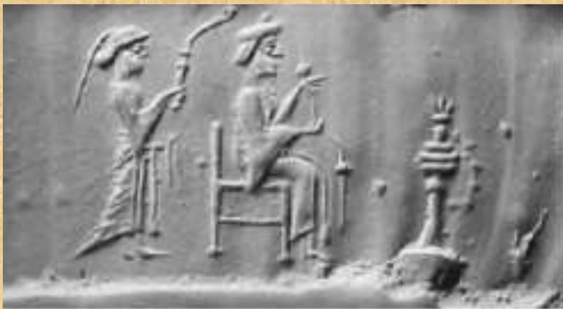
Cylinder seal C16496 Buffalo Museum, New York