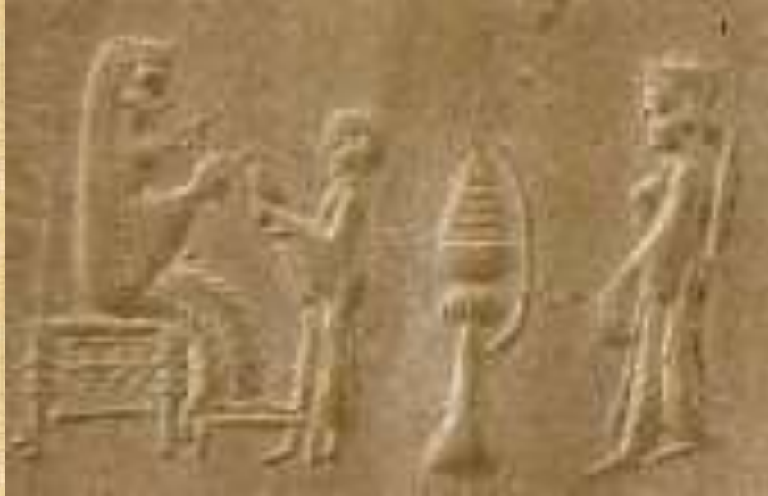
Queen Esther (right, H 3.2 cm) in front of Atossa (Darius' wife and Xerxes' mother) seated on a throne (probably when she married Xerxes in 489 BCE). Musée du Louvre, Paris. Seal dated 5th century BCE (AO 22359)