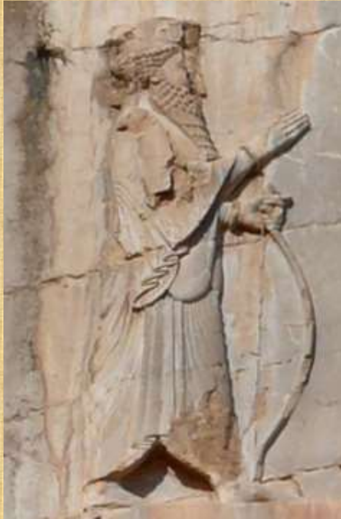
Rock relief of Xerxes at his tomb in Naqsh-e Rostam