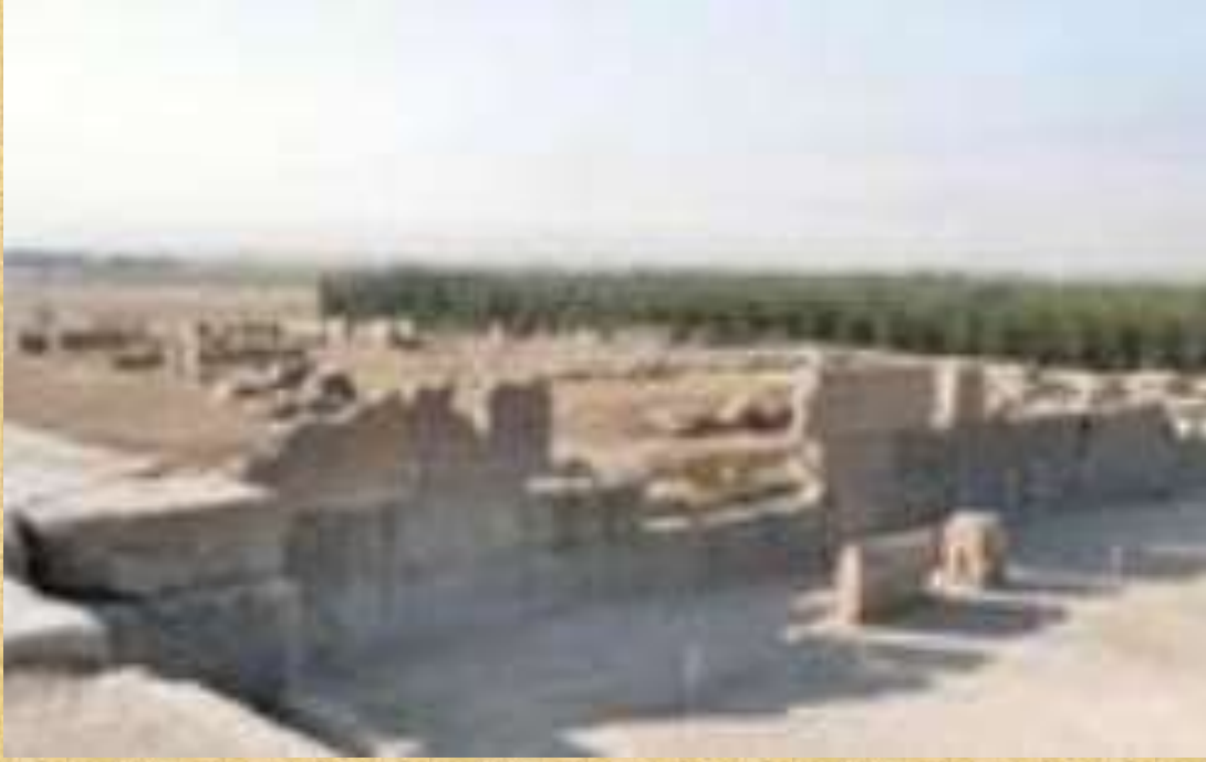
Ruins of King ARTAXERXES I's palace in Persepolis

فكالعادة علم الاثار والاكتشافات التاريخية الاثرية تؤكد دقة الكتاب المقدس وكل ما تكلم عنه من