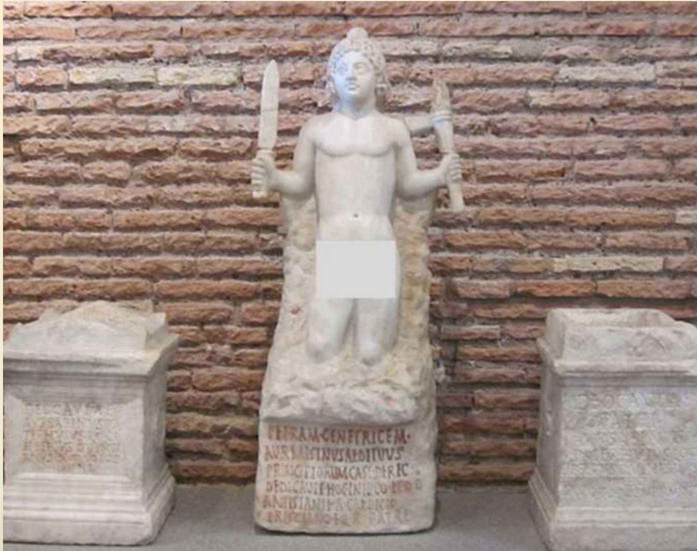
Rock-born Mithras and Mithraic artifacts (Baths of Diocletian, Rome)