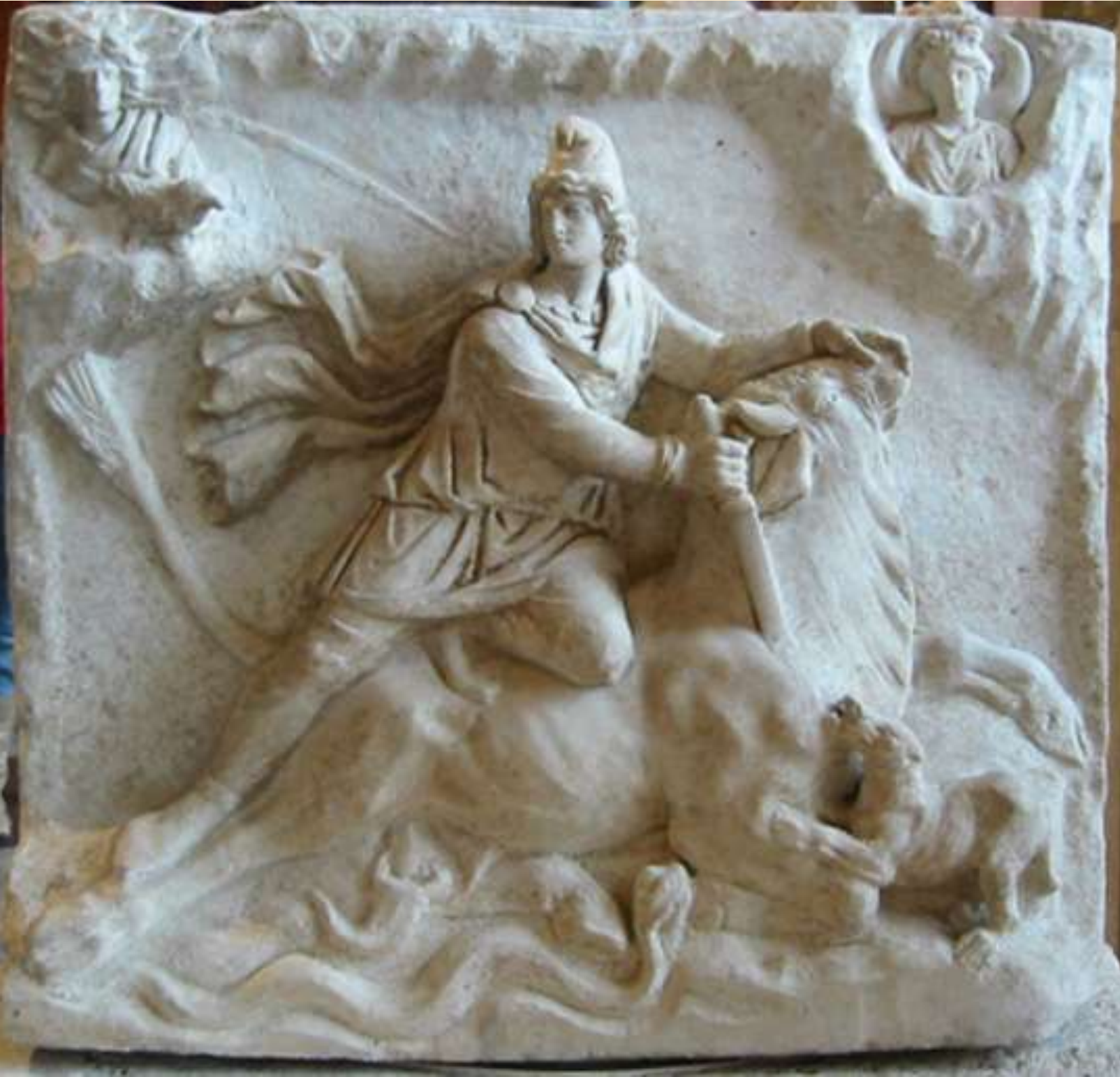
Double- faced Mithraic relief. Rome, 2nd to 3rd century CE (Louvre Museum).