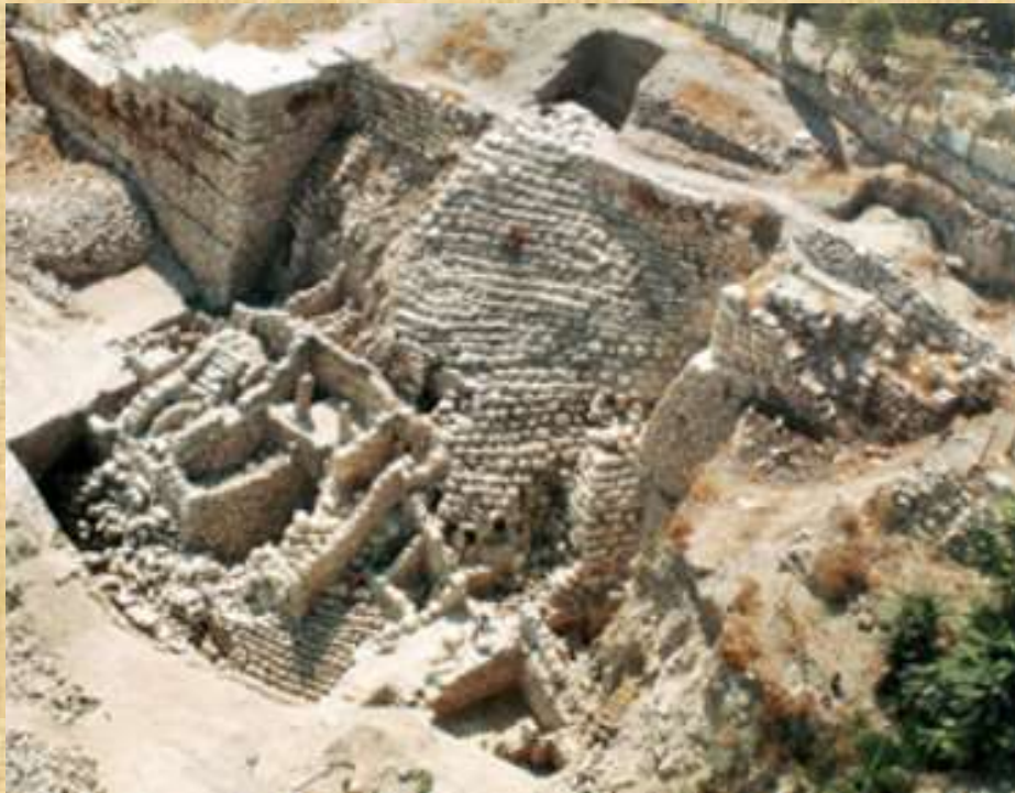
وهذا المبنى الحجري له رؤوس أعمدة مميزة من هذا الزمان