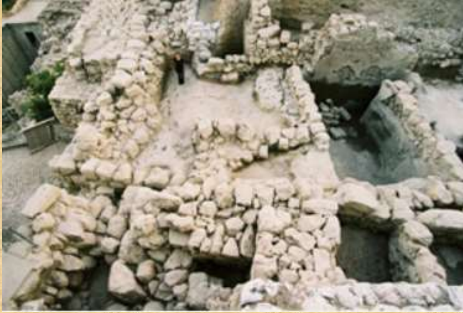
ووجدت انه متداخل مع حجارة السلالم steps stone structure