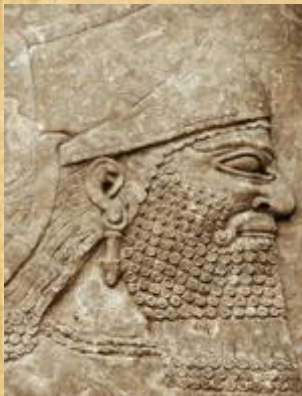
Aššurbanipal (British museum, London)