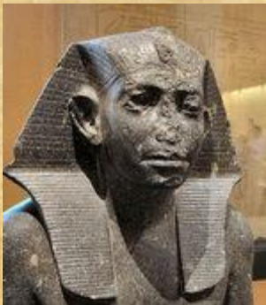
Senusret III (Nelson-Atkins)