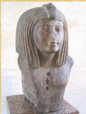
Osorkon I (Louvre, Paris)