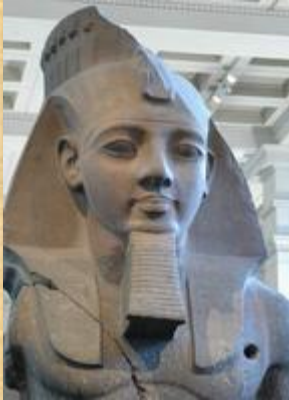
Ramses II (British Museum, London)