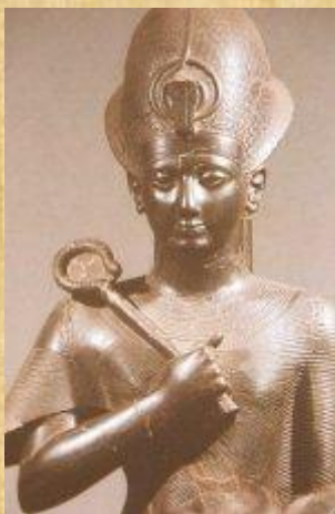
Ramses III (©!!!)