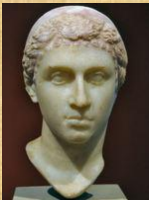
Cleopatra (Altes Museum, Berlin)