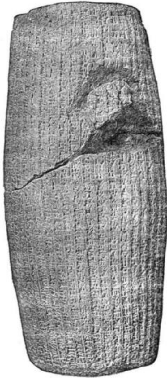
Terra-cotta Cylinder containing the history of the capture of Babylon by Cyrus the Great, king of Persia.