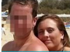
Barclays cashier, 25, jailed after she