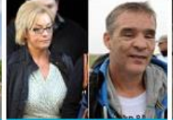
PC blinded by Raoul Moat