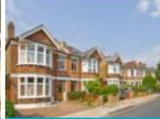
The big squeeze: Average British