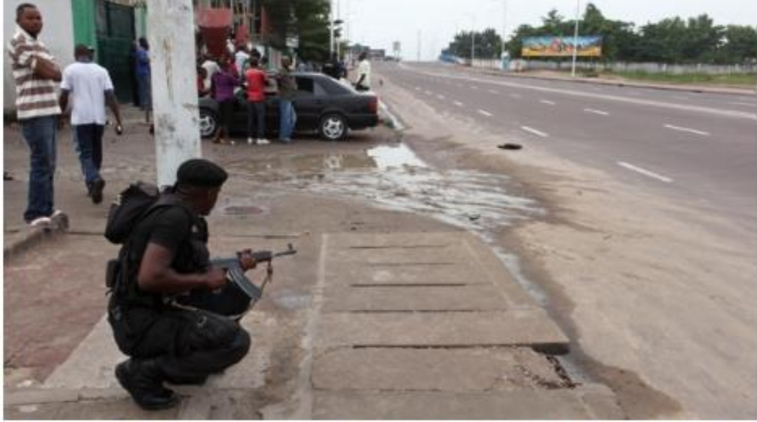
A Congolese security officer takes position to secure the street near the state television headquarters in the capital Kinshasa on Monday. Armed youths tried to seize the TV station, the airport and a military barracks before being repulsed by troops. In clashes the government said killed 103 people, including eight soldiers.

Thomson Reuters Posted: Dec 31, 2013 4:25 AM ET | Last Updated: Dec 31, 2013 9:51 AM ET