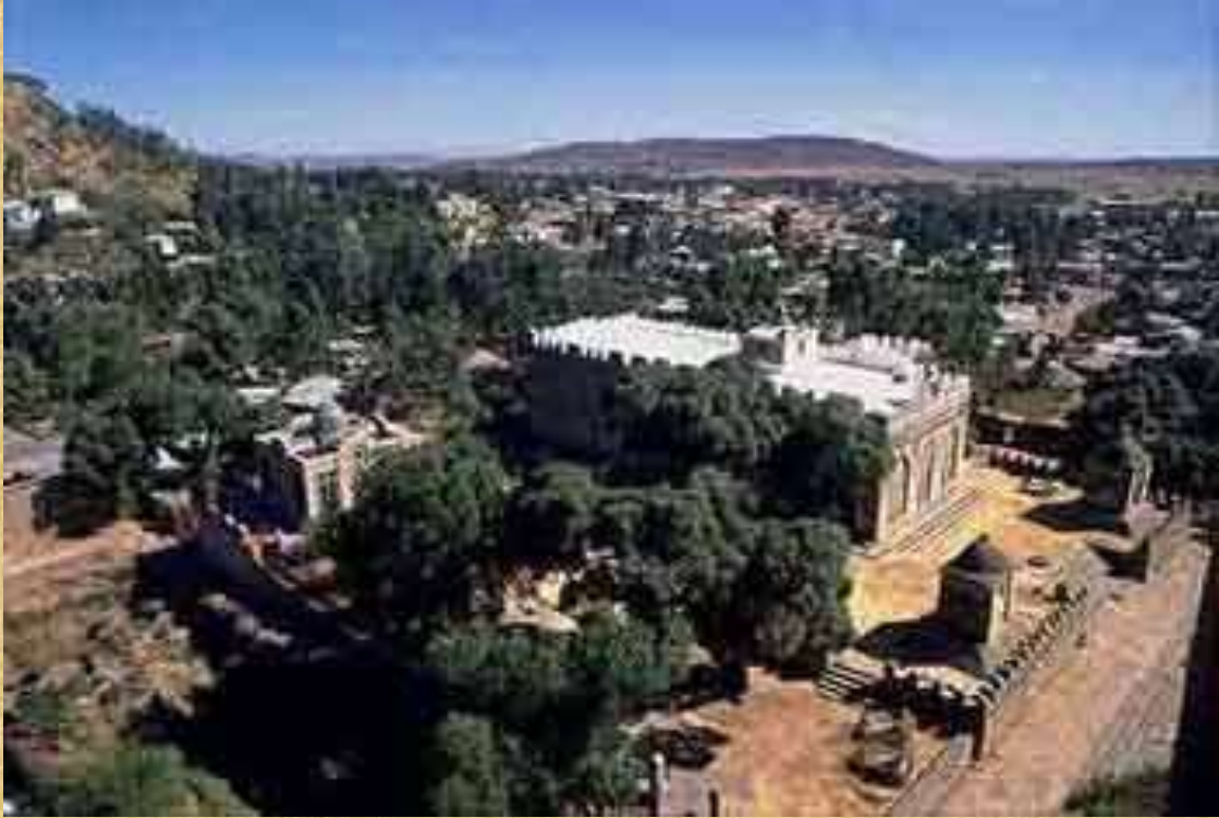
St. Mary Church in Axum, Ethiopia.

أن سليمان تزوج ملكة سبأ وأنجب منها ابن اسمه مينليك Menelik هو نقل تابوت عهد الرب (والبعض يقول نسخة من تابوت عهد الرب) الي أثيوبيا ومن هذا الوقت مجموعة سرية من الكهنة تحرسه جيل عن جيل.