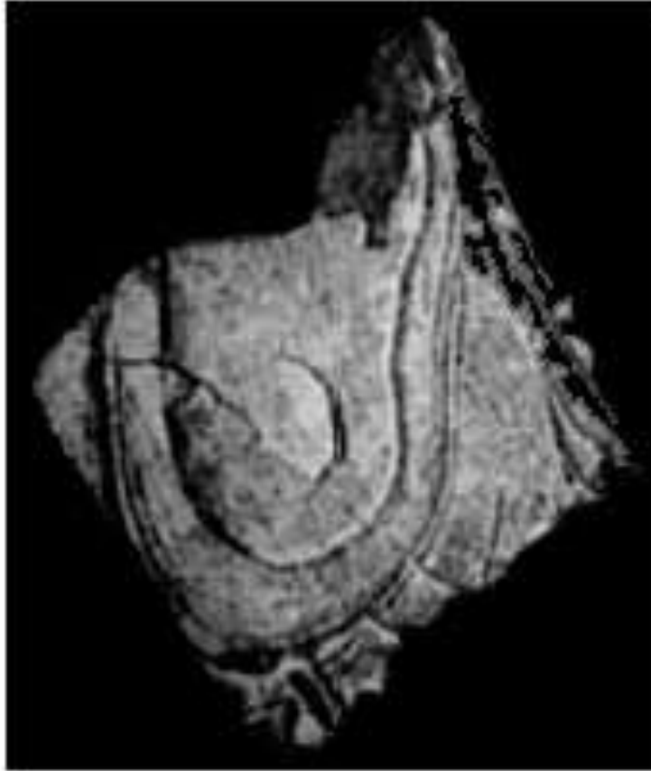
The Fisher Canyon 'footprint'