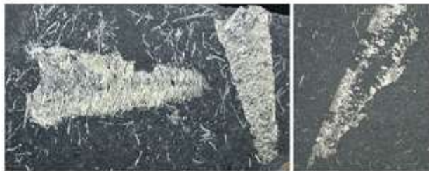
Larval cases surrounded by dispersed silk strips in dark shale from southern Brazil. Image credit: © 2016 Scientific Reports. Adapted for use in accordance with federal copyright (fair use doctrine) law. Usage by ICR, does not imply endorsement of copyright holder.

Brazilian and Polish researchers described what look like caddisfly larvae silk structures in layered shale rocks from southern Brazil. The white silk-like strands stand out from the surrounding dark gray shale. The authors' results appear in the online journal Scientific Reports . 2 Known as underwater engineers, some species of caddisfly larvae spin special sticky silk homes to which they attach organic debris for camouflage. The fossilized caddisfly casings also had ancient debris attached to them.