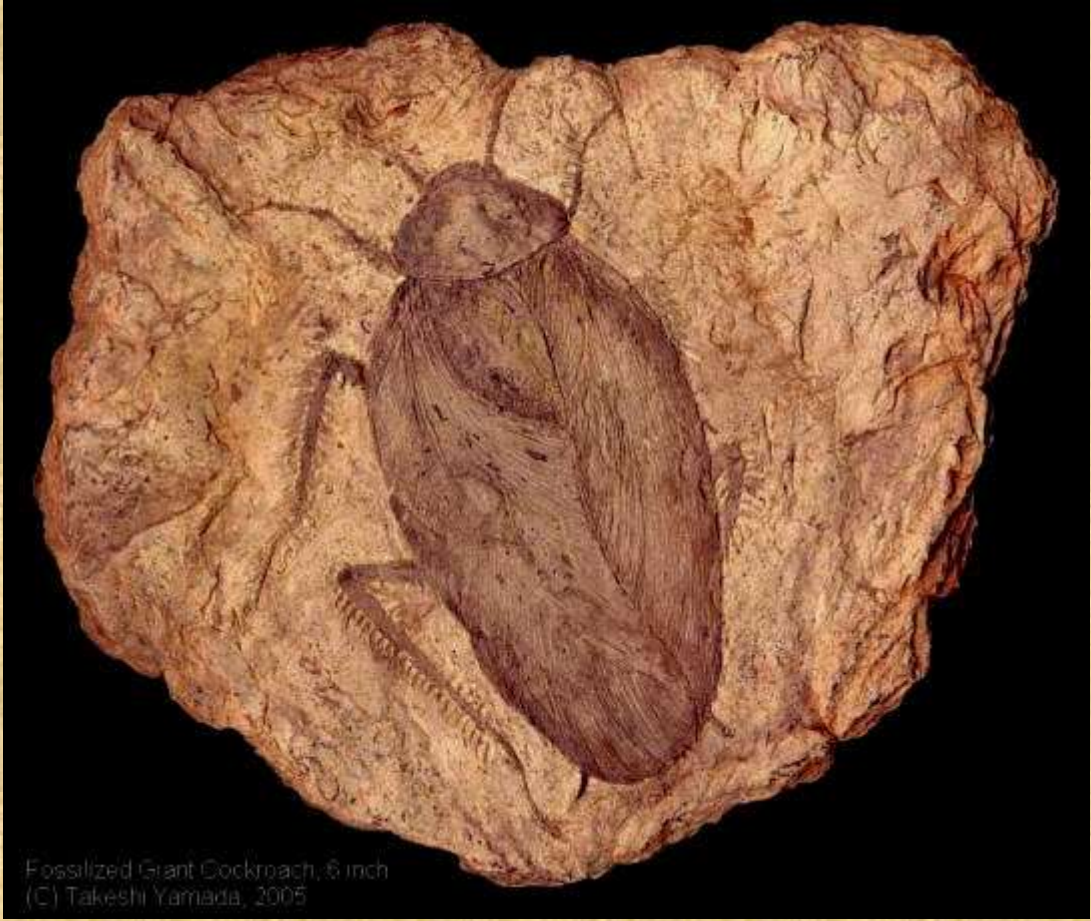
Fossilized Giant Cockroach, 6 inch