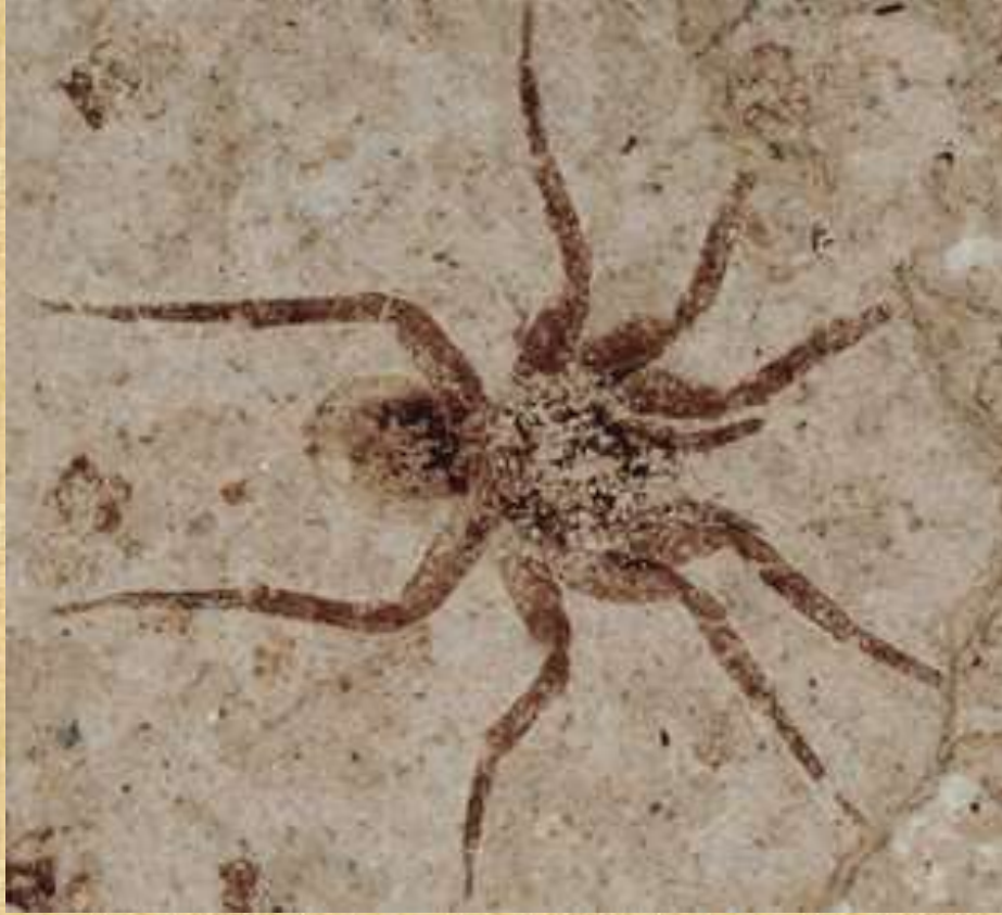
وحفرياتها في العنبر محفوظة بدقة ووضوح