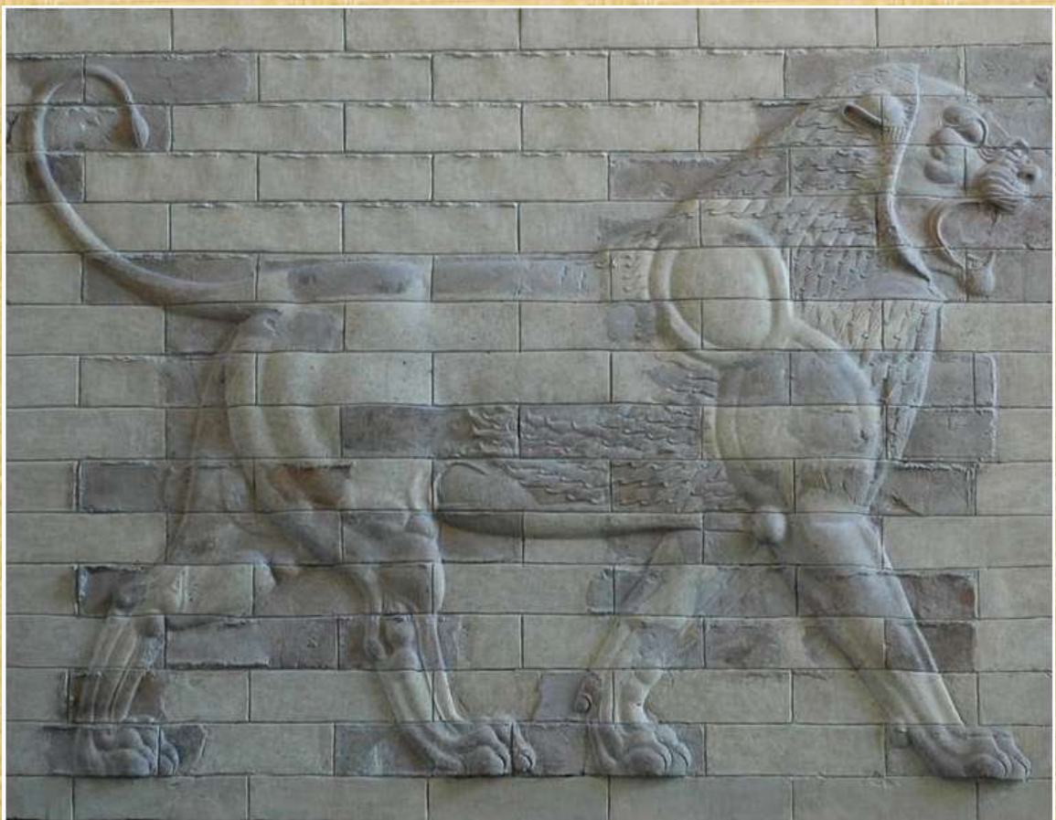
Lion on a decorative panel from Darius I the Great's palace