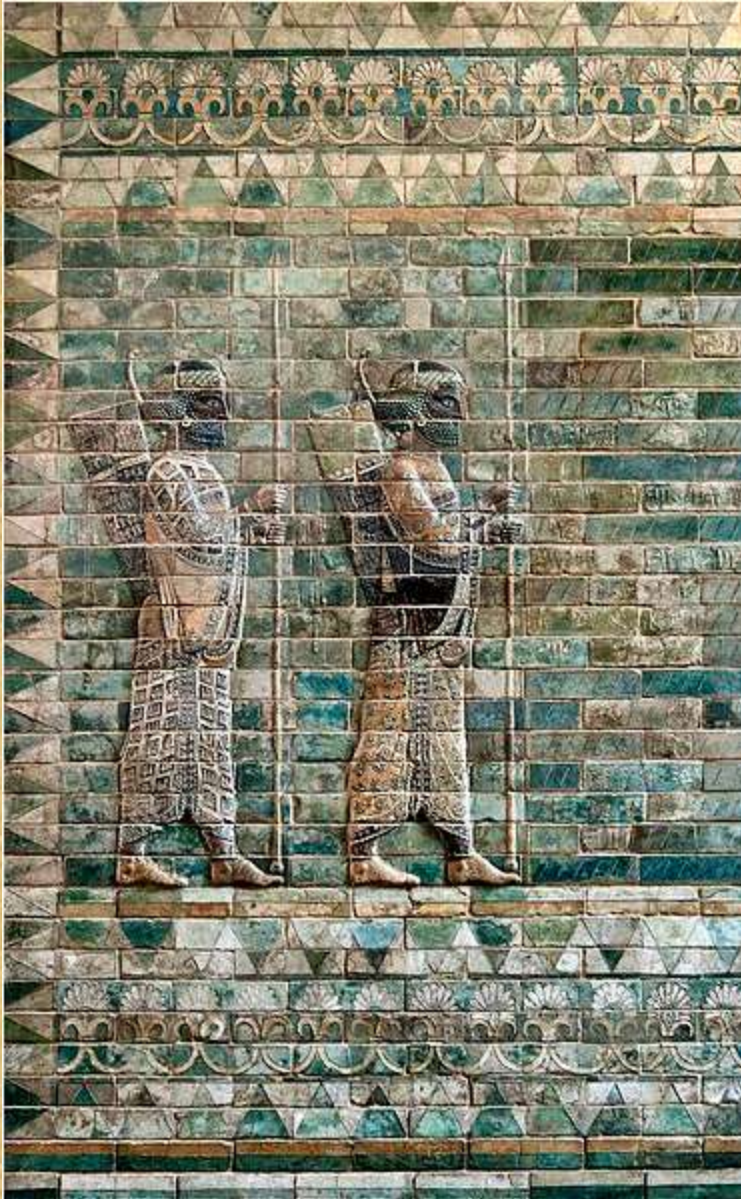
Archers frieze from Darius' palace at Susa. Detail of the beginning of the frieze, left. Louvre Museum