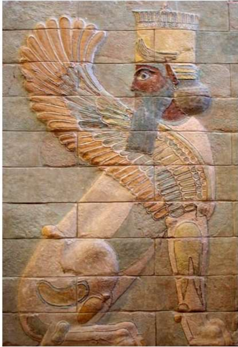
Winged sphinx from the palace of Darius the Great at Susa.