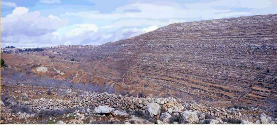
Fig. 2 Mountain (Jebel et-Tawil) east of el-Bireh (Bethel). The settlement Pesagot has been established on top of the mountain since this photograph was taken.**

وهي بالفعل في الطريق الذي لا يزال يعبر بها حتى الان