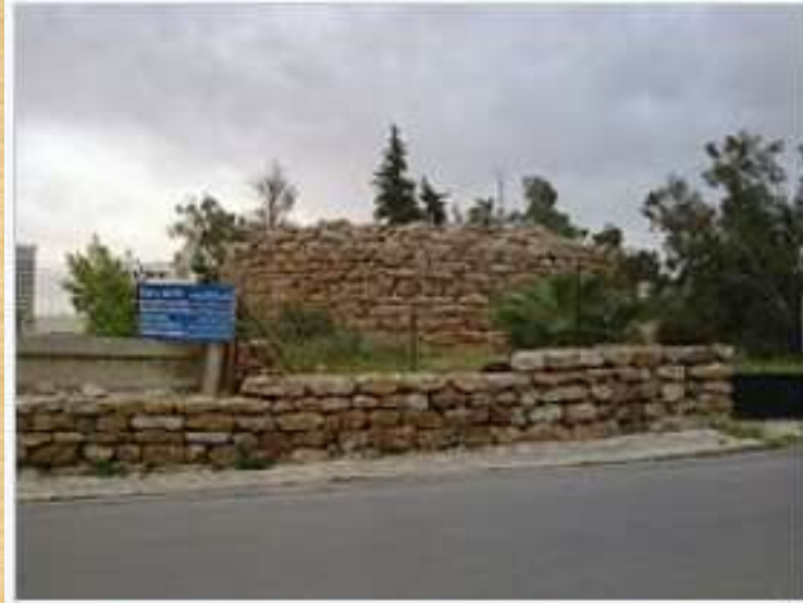
An Ammonite watch tower at Rujm Al-Malfouf in Amman