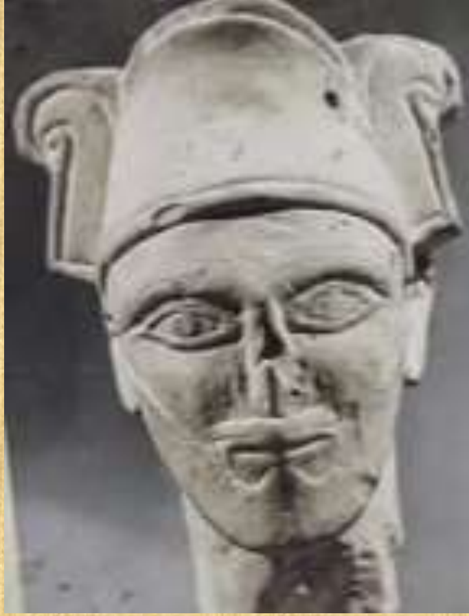
وملوك بني عمون