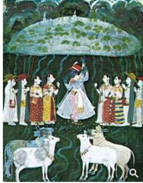
Krishna lifting Mount Govardhana, Mewar miniature painting, early 18th century, in a private collection.

عن عبادة اندرا فيغضب اندرا ويسقط سيول ولكن كريشنا يرفع جبل جوفاردهانا على اصبعه ويحمي الناس من السيول لمدة سبع أيام فيهدا اندرا