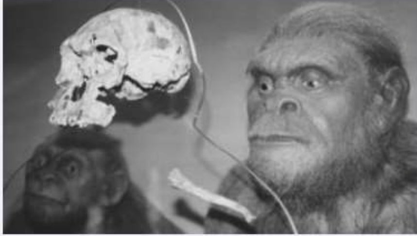
A display at the San Diego Museum of Man, shows a replica KNM-ER 1470 cranium shadowed by a couple of 'apemen' models.

المتاحف المؤيدة للتطور كما بهذه الصورة في متحف سان دييجو