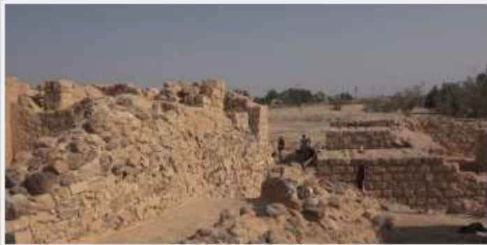
Archaeologists believe they have found the gates to King

And all of Shlomo's garrison towns, chariot towns, and cavalry towns—everything that Shlomo set his heart on building in Yerushalayim and in the Lebanon, and throughout the territory that he ruled.” (1 Kings 9:19)