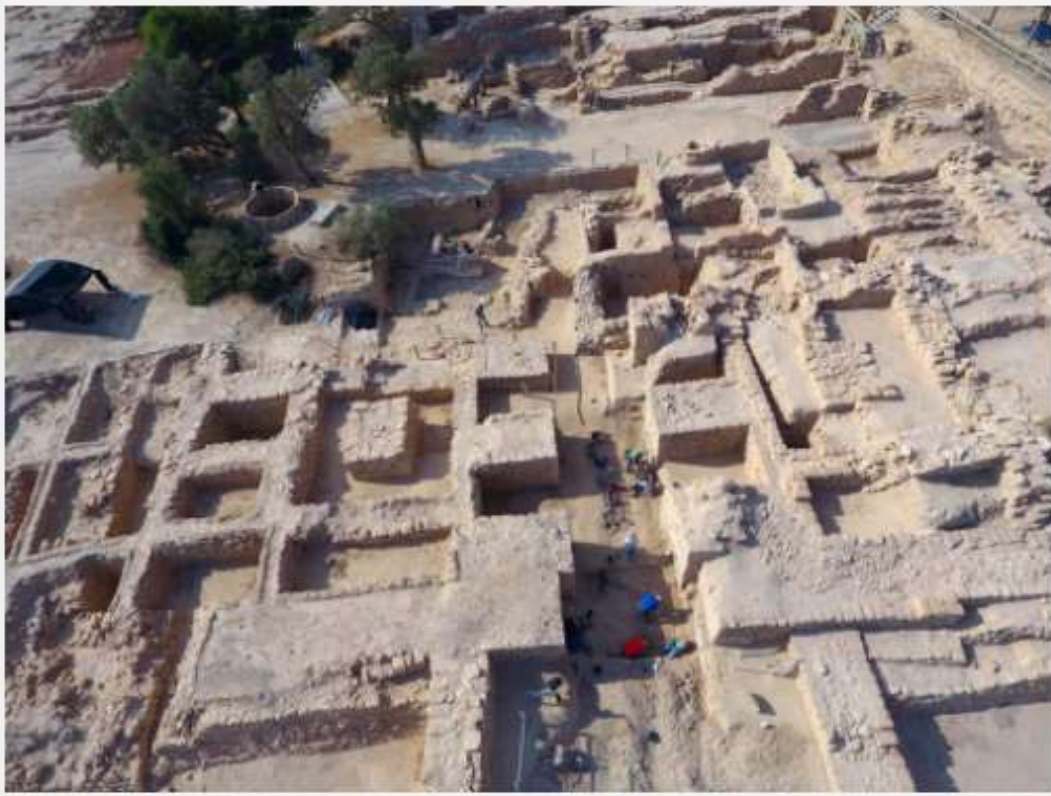
An aerial view of the excavations at Tamar.

وأيضاً يوجد فيها نظام البوابات المميزة لسليمان