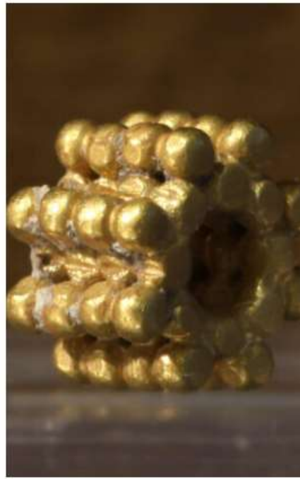
A First Temple-era gold bead discovered in earth from the Temple Mount Sifting Project.

فكل هذا يضاف الى الأدلة من الاثار الكثيرة التي تتؤكد صحة الكتاب المقدس