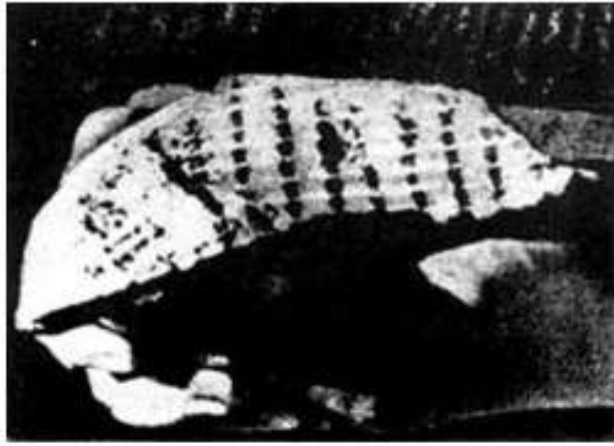
The photograph from Smena showing the supposed footprint

في سنة 1959 بعض العلماء الصينيين ومعهم علماء سوفيتيين متخصصين في حفريات الانسان واثاره بقيادة Dr Chow Ming Chen (ينطق Tschou Ming Tschen) وجدوا اثار اقدام حذاء بشري واضح في طبقة صخر رملي. ولكن الإشكالية ان الطبقة محدد عمرها بدقة 2 مليون سنة. فكيف اثار قدم بشري يرتدي حذاء من 2 مليون سنة؟ مقياس القدم وجد انه يساوي 43 نمرة بالمقياس الأوروبي ووجد ان التجويف المار بالطول مميز هذا نشر في مجلة Smena السوفيتية في 8 نوفمبر 1961 م ونشرت الصورة السابقة. وبعد هذا نشرت في العديد من المجلات