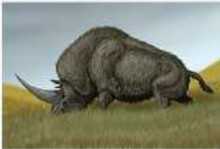
E. sibiricum restoration

Paleolithic art from Rouffignac Cave, France, judged on the basis of the single horn to depict Elasmotherium by Schaurte in 1984 and again independently by N. Spassov in 2001. If true, the judgement would extend the range to Western Europe. [82]