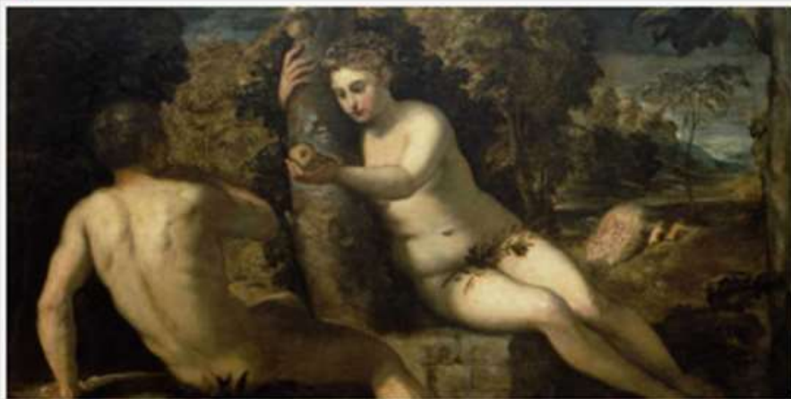
Adam and Eve in the Garden of Eden, by Tintoretto, 1550.

The man named his wife Chava, because she was the mother of all the living. Genesis 3:20 ( The Israel Bible™ )