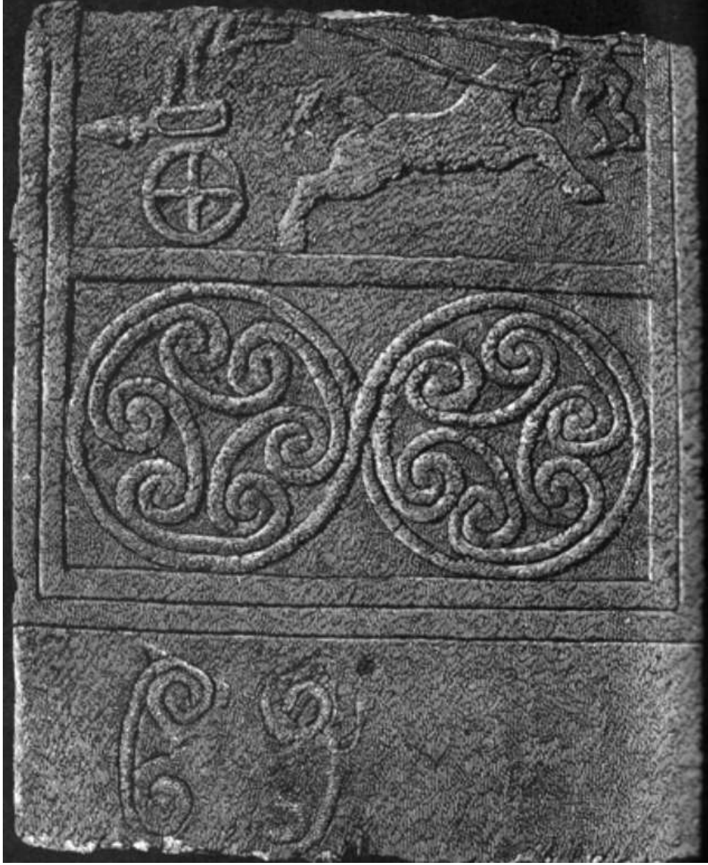
Grave V Stela 3

ولكن اللوحة التي نحن بصددھا هي غير موجود فيها أي حيوانات ولا معركة لأن أحدهما فقط يحمل سلاح، ولكن شكل مميزة لحدث مميز. ولهذا جورج مايلوناز عن اللوحة التي نتكلم عنها