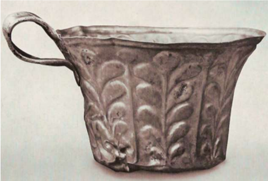
Cup from Grave VI,

كتميز عن اكواب النبيذ التي يرسم عليها كرم