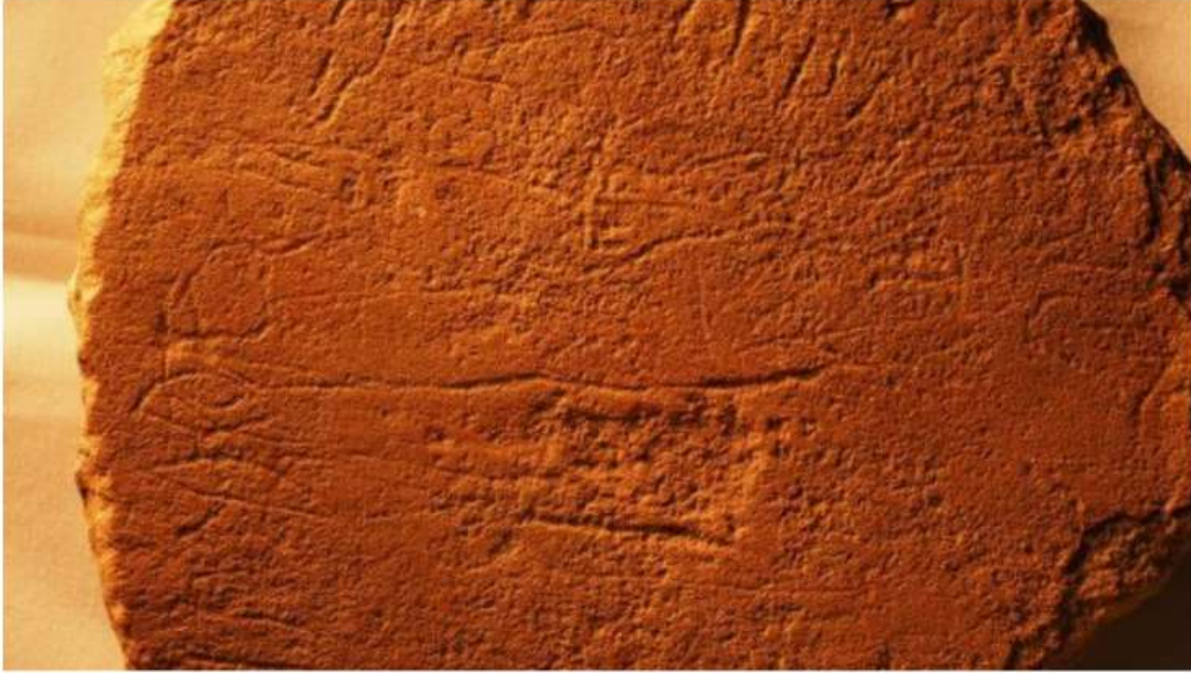
A photo of Sinai 375a, a stone slab from Egypt, which is now located in the Harvard Semitic Museum. This photo contains the name Ahisamach (Exodus 31:6) on the two horizontal lines.

The oldest recorded alphabet may be Hebrew. According to a controversial new study by archaeologist and ancient inscription specialist Douglas Petrovich, Israelites in Egypt took 22 ancient Egyptian hieroglyphs and turned them into the Hebrew alphabet over 3,800 years ago.