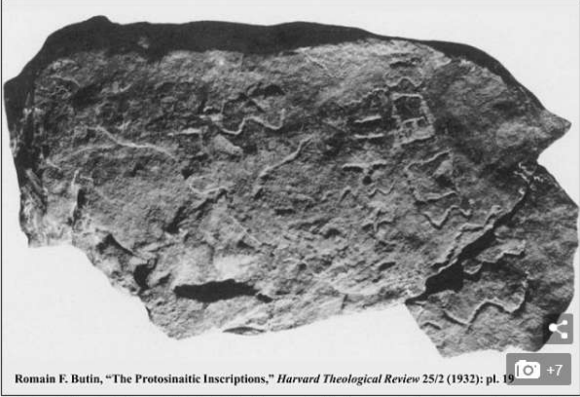
A photo of Sinai 361, located in the Cairo Museum. This photo contains the name Moses (M-Sh, the two fullest letters on the smaller fragment of the inscription) at the bottom of the first vertical column