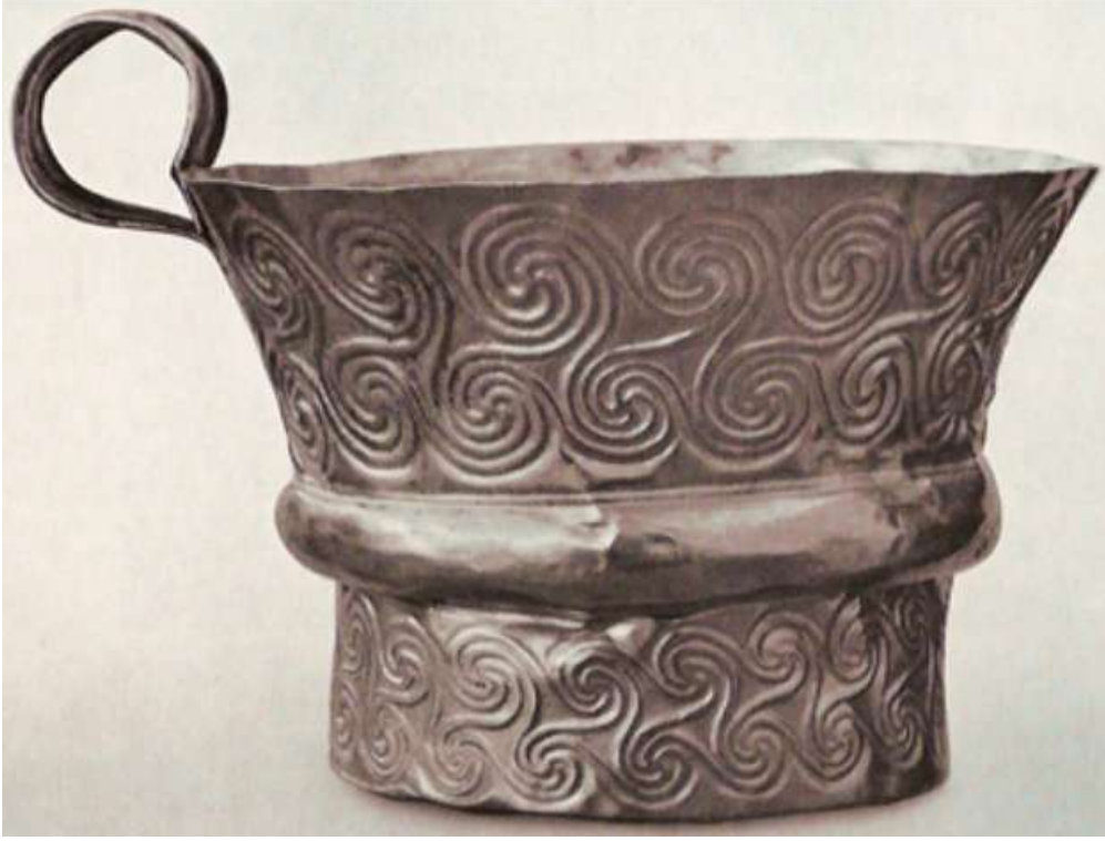
Cup from Grave V, with swirly designs

كتميز عن اكواب النبيذ التي يرسم عليها كرم