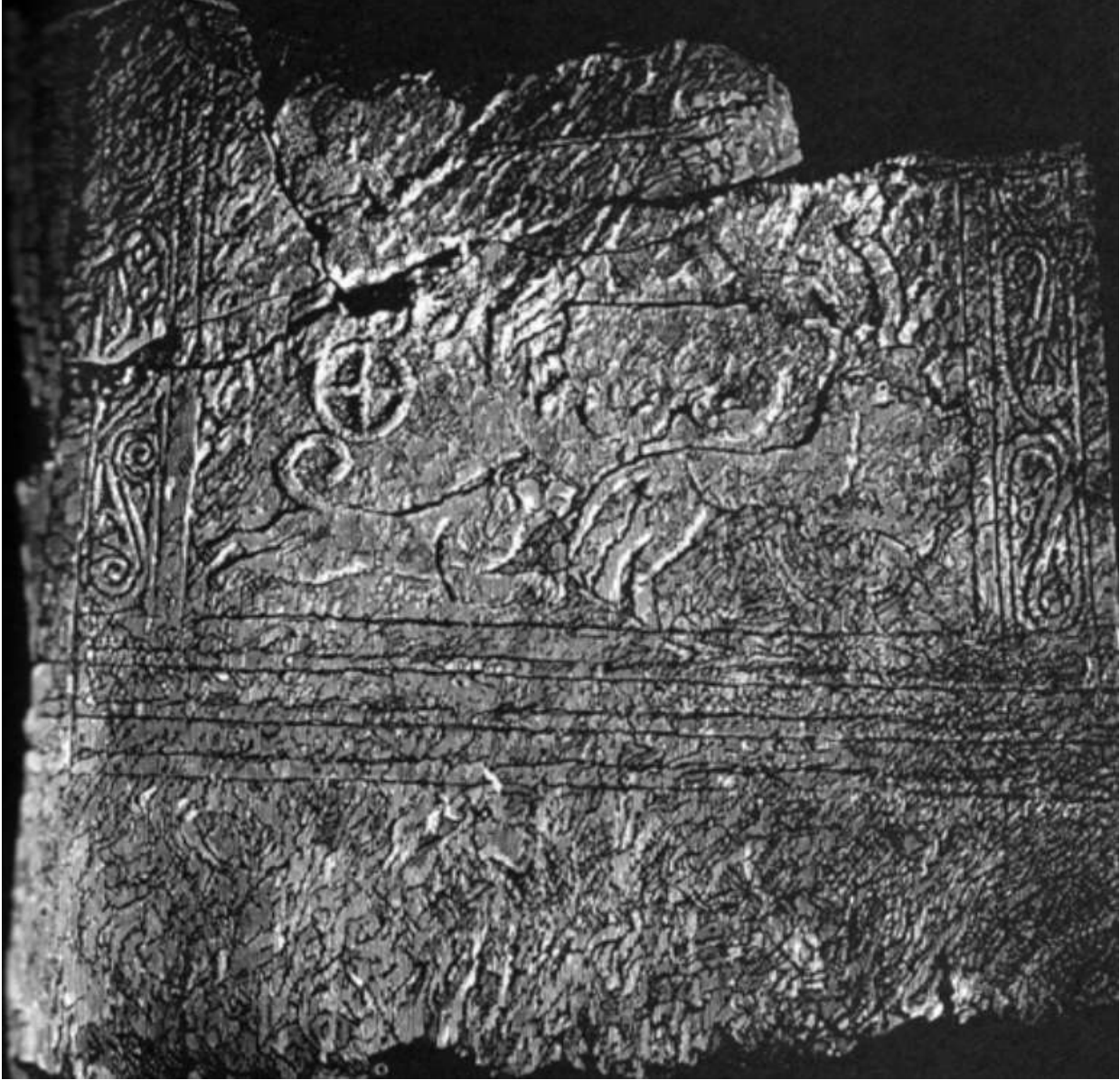
Grave V Stela 1